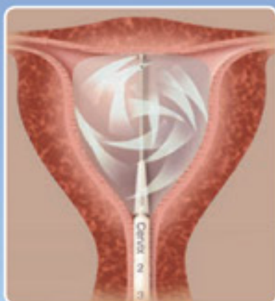
Druck, Zirkulation und Wärme