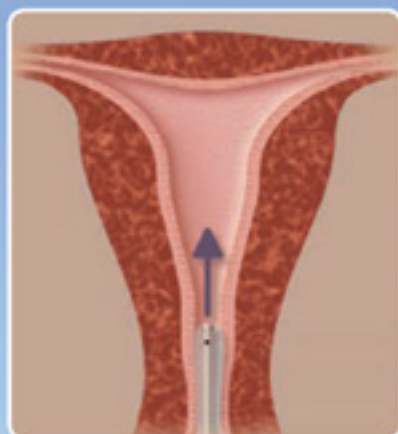
Der Ballonkatheter wird in das Cavum Uteri eingeführt

Die abgestimmte Kombination von Temperatur und Druck über eine Dauer von nur 10 Minuten erreicht eine dauerhafte Behandlung der starken Monatsblutungen.